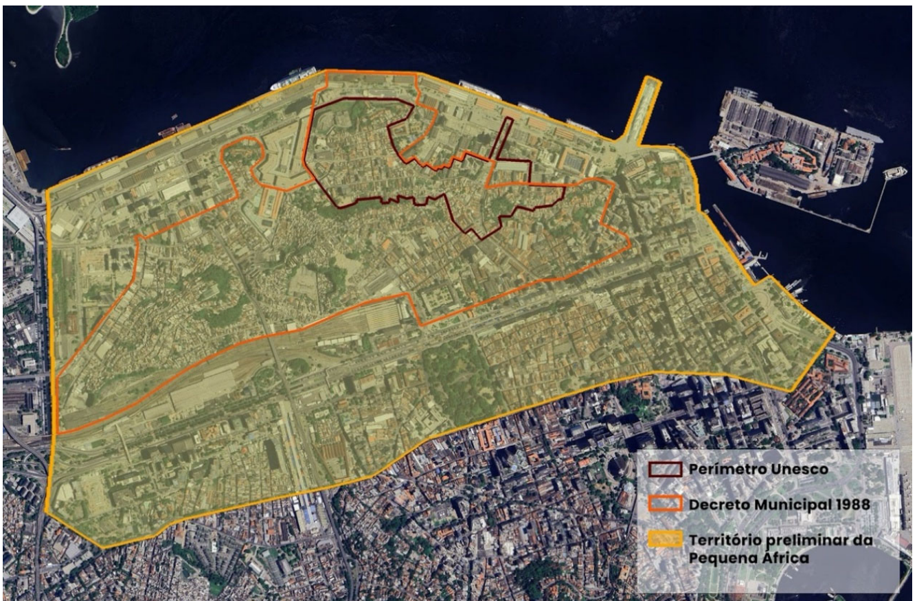
Perímetros Pequena África.

1.2 No interior do perímetro do Território Preliminar da Pequena África – descrito abaixo –, serão identificados marcos e rotas de significativa relevância cultural e histórica. Estes elementos deverão ser integrados por meio de intervenções que promovam sua conexão visual e funcional, com o objetivo de reforçar a nova identidade visual proposta. Estas intervenções deverão contemplar soluções de comunicação visual e propostas de mobiliário urbano, podendo ser associadas a outras intervenções de pequeno porte. O resultado almejado consiste na formação de uma área de identidade distintiva para a Pequena África, caracterizada por uma linguagem visual coerente e integrada em todas as suas intervenções, capaz de ressaltar a característica de museu de território da região.